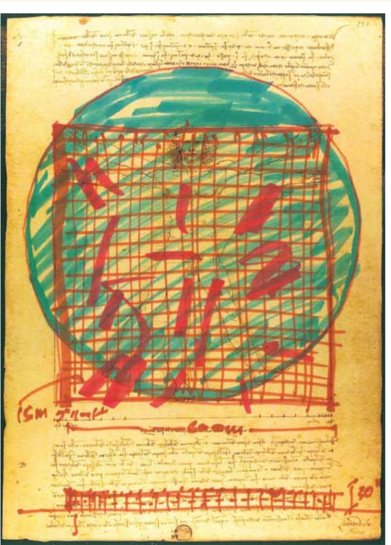
エジプト日本科学技術大学のコンセプトスケッチ