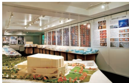
第72回 展覧会「新居千秋展 不均質な不均質」展示協力：新居千秋都市建築設計、武蔵工業大学 新居研究室 2008年6月9日～17日 16日には新居千秋氏をゲストに講演会「ローカリティを表現する建築」も開催、進行は今川憲英氏