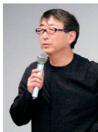
左—第69回 展覧会「生成する秩序 展覧会『台湾3大プロジェクト』台中メトロポリタン・オペラハウス / 2009 ワールドゲームズメインスタジアム / 台湾大学新社会科学部棟」展示構成：東京理科大学 川向研究室、展示協力：伊東豊雄建築設計事務所 2008年3月10日～19日 右—同対談「現代建築のゆくえ」の伊東豊雄氏、対談相手・企画は川向正人氏 3月18日