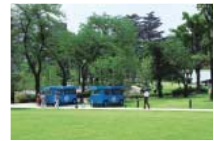
森のエッジゾーン 山から出て高原に至る境界エリア