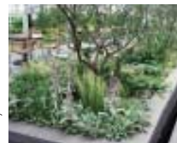
右—植物の配置は色彩の統一感、形と質感のコントラストを楽しむよう植栽した 下—このテラスガーデンの最も美しいのがトワイライト。夏の夕刻にぜひ訪れてほしい。彫刻のデザインは、吉谷博光（写真4点とも：吉谷桂子）