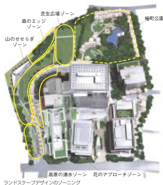
ランドスケープデザインのゾーニング

外苑東通りとタワーの関係にも着目し、マンハッタンのロックフェラーセンターと5thアベニューの関係性と同様に、アクセスをしやすく明快なアプローチによって連続した人の流れを演出した。日本庭園に見られる岩や植物といった要素が、庭園自体のランドスケープと常に少しずつ重なり合う関係を空間に取り込み、「JAPAN VALUE」という概念と日本庭園という概念をシンプルに、抽象的に重ね合わせている。