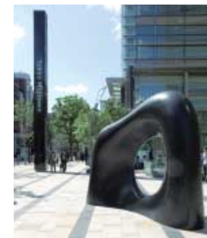
安田侃「妙夢」（ブロンズ 2006）