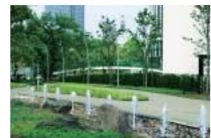
高原の湧水ゾーン 人々を緑地へ導く水景施設

「東京ミッドタウン」は、植栽と建物とアートが一体となり、それぞれのシーンが風景として連続してつながっている。*