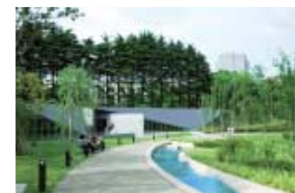
山のせせらぎゾーン 敷地奥の「21_21DESIGN SIGHT」に導びく、緩やかに流れるせせらぎ