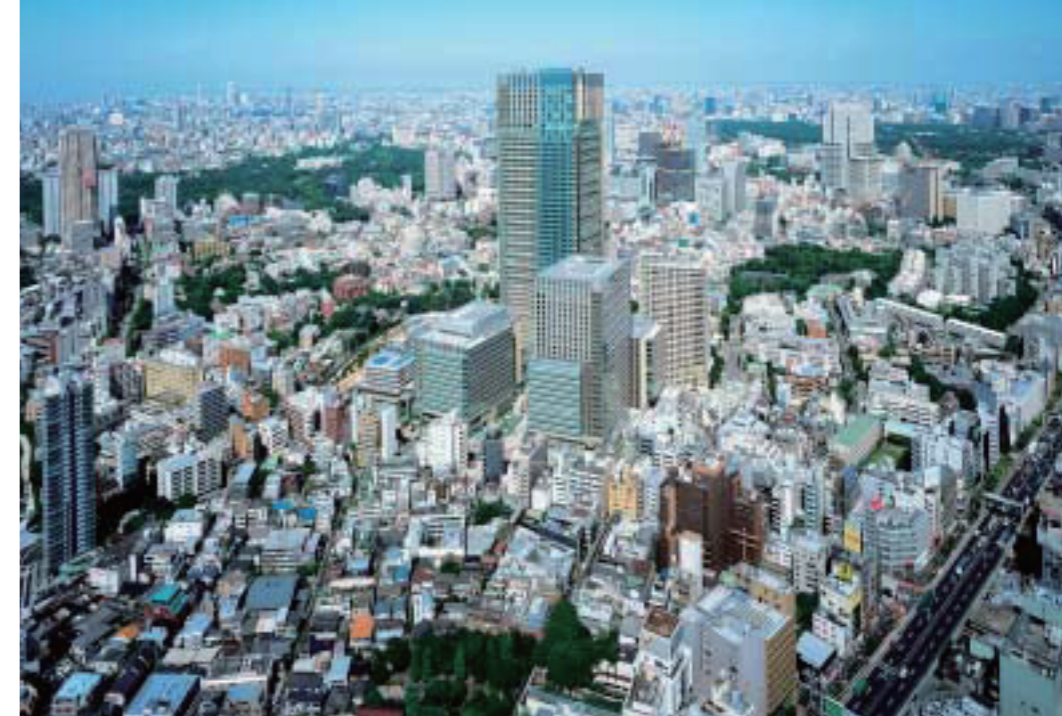
上—上空から見たミッドタウン 下—ガレリア吹抜け

ントを通して、周囲の街と共生したいとの思いであった。もともと防衛庁は堀に囲まれた閉鎖的な場所だった。しかし、新しく誕生した「東京ミッドタウン」は街として地域の方と良好な関係を築いていきたいと考えた。そのためには東京ミッドタウンマネジメントが地元を根をはり、この地で、近隣町会や商店会の方々と、話し合いをしながら、地域の一員として、地域とともに盛り上げていければと思っている。