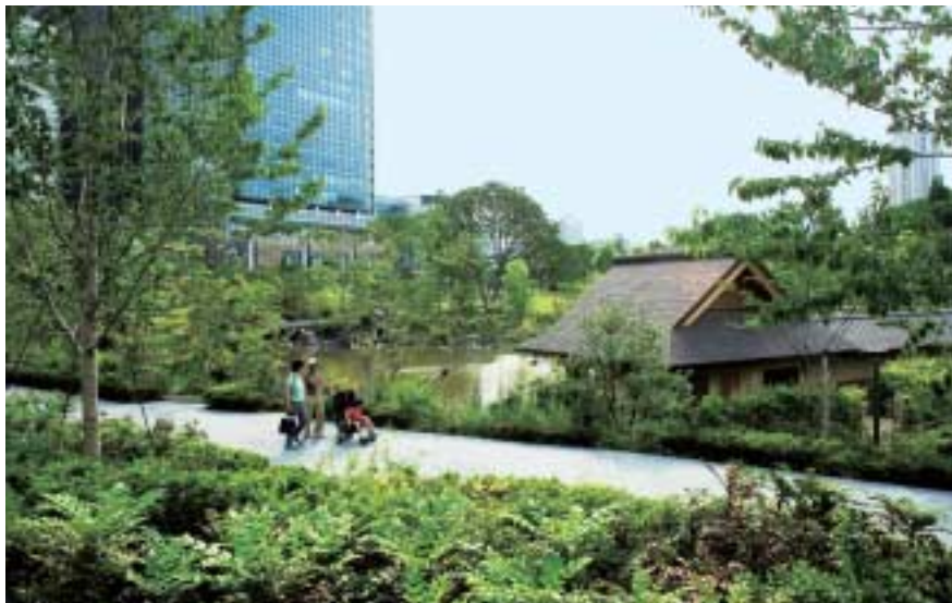
五感に響く、魅力的な水辺に出会える榎町公園

昭和63年に「国の行政機関等の移転について」の閣議決定以来、都内における各政府機関の移転先等が順次明らかになり、平成11年度以降、防衛庁榎町庁舎等用地約7.8haの広大な跡地が発生することとなった。この跡地は、都心部に残された貴重な空間であり、周辺地域を含めた街づくりのための貴重な資源となるものである。このようなことから平成7・8年度の2カ年にわたり、当該跡地および周辺を含めた跡地利用計画における整備方針、整備手法について検討し、東京都の跡地利用の考え方を平成9年に報告書としてまとめた。