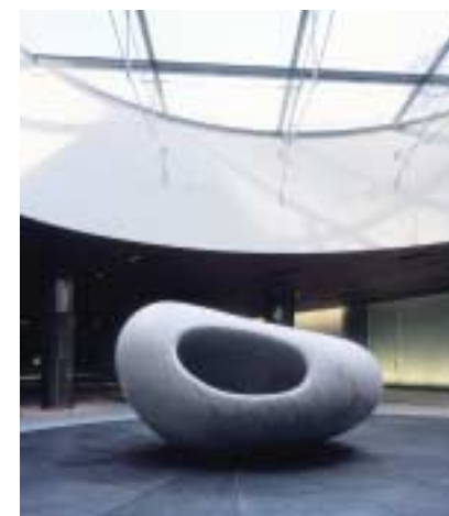
安田侃「意心帰」（大理石 2006）