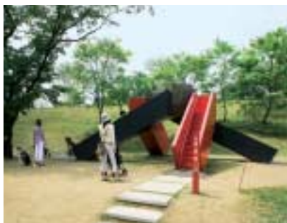
幾何学文様や巴紋から想を得た、楕状の滑り台

昭和63年に「国の行政機関等の移転について」の閣議決定以来、都内における各政府機関の移転先等が順次明らかになり、平成11年度以降、防衛庁榎町庁舎等用地約7.8haの広大な跡地が発生することとなった。この跡地は、都心部に残された貴重な空間であり、周辺地域を含めた街づくりのための貴重な資源となるものである。このようなことから平成7・8年度の2カ年にわたり、当該跡地および周辺を含めた跡地利用計画における整備方針、整備手法について検討し、東京都の跡地利用の考え方を平成9年に報告書としてまとめた。