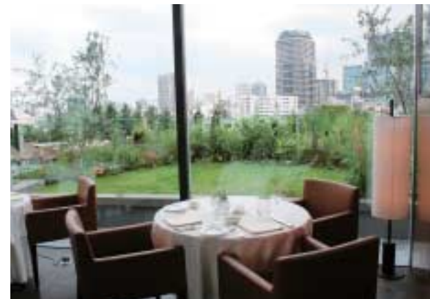
上—フィリング・プランツの斑入りリュウノヒゲ。シンボルツリーは7本のオリーブの木 下—店内からも庭の眺めを楽しめるよう草花を配置。季節ごとに異なる眺めを楽しめる