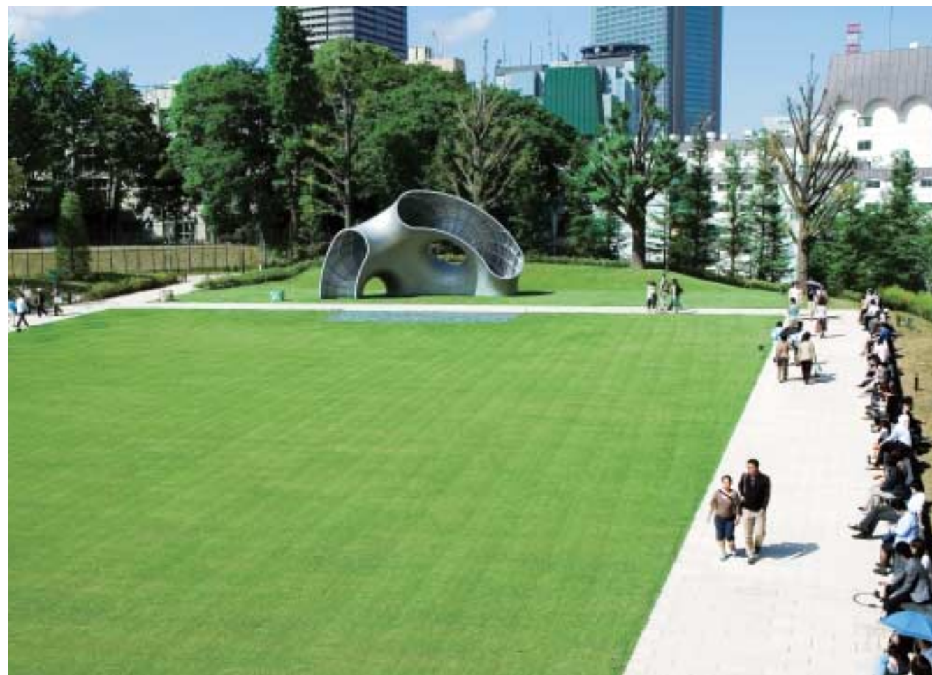
芝生広場ゾーン 憩いの広場を演出しながら、ガレリアからのアイストップ的な役割となっている

「東京ミッドタウン」の植栽の種類は約100種ほどに上る。樹木は、中木を避けて高木と低木を配し、見通しを良くするなどセキュリティに配慮した計画となっている。また、マスタープランの当初から、ガレリアから芝生広場に架かるブリッジなど、商業施設の回遊性に通じるアイデアも盛り込まれている。商業エリアからの視覚にも配慮し、飲食ゾーンの足元には緩やかにカーブする敷地内通路に沿って季節を彩る植栽を配置した「花のアプローチゾーン」を計画し、外部のウッドデッキと一体となって商業エリアを華やかに演出している。