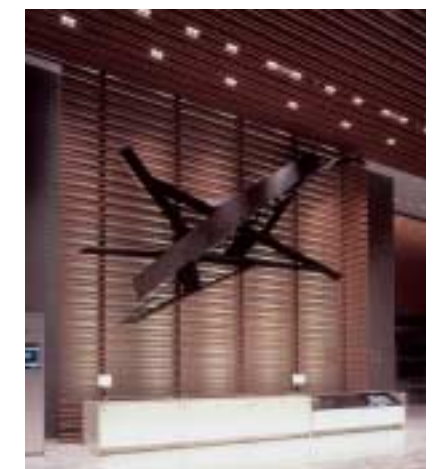
五十嵐威暢「予感の海へ」（木、墨 2006）