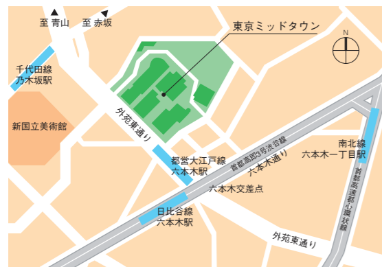
「東京ミッドタウン」周辺