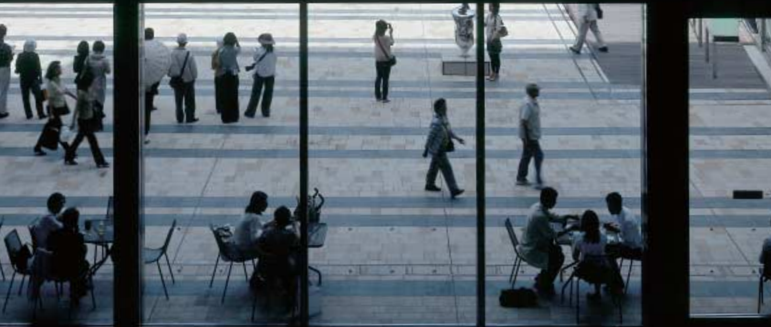
コートヤード越しに芝生広場を望む。奥のアートは、フロリアン・クラール「フラグメントNo.5」（アルミニウム 2006）