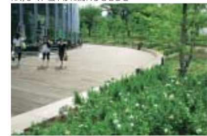
花のアプローチゾーン 視覚的にも機能的にも商業エリアの外部と内部を連続させている