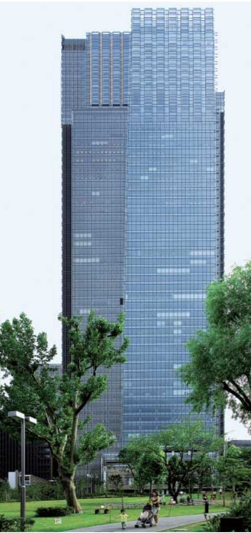
檜町公園からミッドタウン・タワーを見る

スイートルーム 角部屋に位置するスイートルームには2面に配された大きな窓があり、高層階ならではの煌々夜景が堪能できる