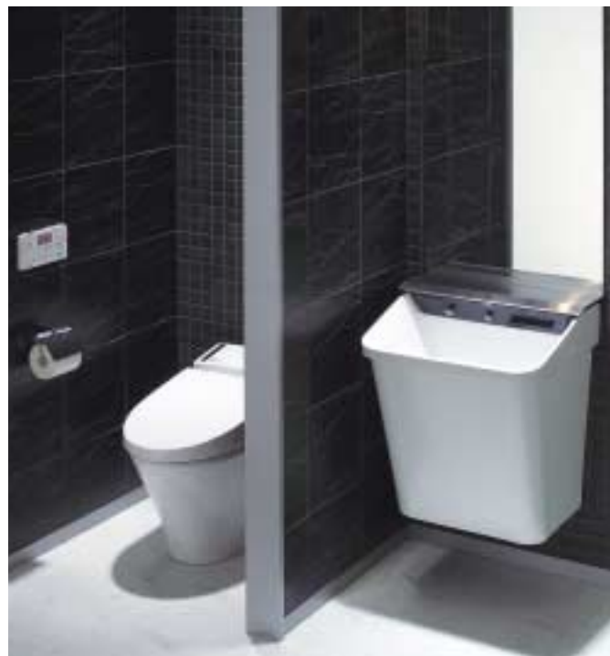
■公共施設のパウダールームでの困りごと